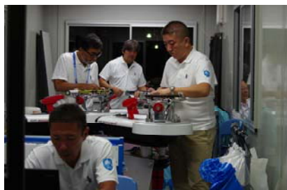
連日、夜遅くまで選手の張り替えに精を出す「張人」ストリンガー