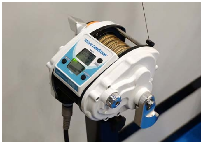
『ミヤ・リードロン』