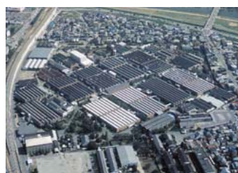
ニッケ印南工場 NIKKE INNAMI MILL