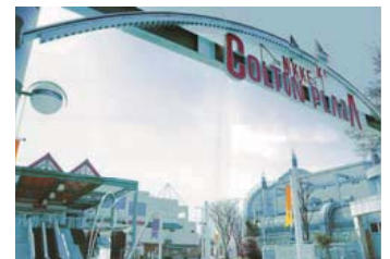
ニッケコルトンプラザ NIKKE COLTON PLAZA OFFICE