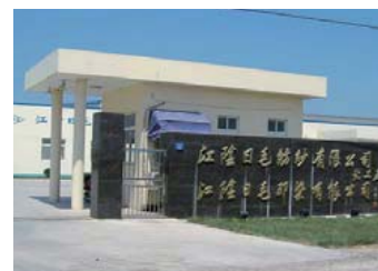
江陰日毛紡績有限公司 江陰日毛印染有限公司 JIANGYIN NIKKE WORSTED SPINNING CO., LTD. JIANGYIN NIKKE DYEING CO., LTD.