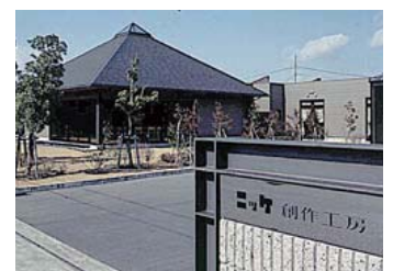
ニッケ創作工房 NIKKE TEXTILE DESIGN & CREATION CENTER