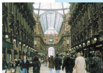
ニッケミラノオフィス NIKKE MILANO OFFICE