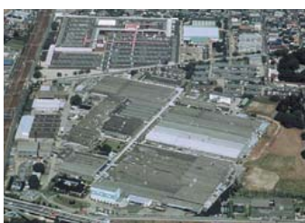
ニッケー宮工場 NIKKE ICHINOMIYA MILL