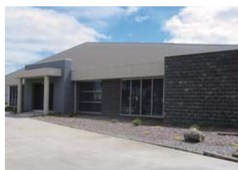
ニッケポートフィリップスカーリング社 NIKKE PORT PHILLIP SCOURING PTY., LTD.