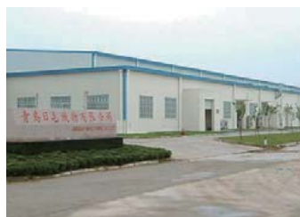
青島日毛織物有限公司 QINGDAO NIKKE FABRIC CO., LTD.