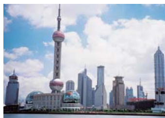
日毛(上海)貿易有限公司 NIKKE (SHANGHAI) TRADING CO., LTD.