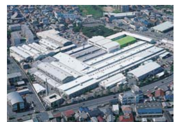
アンビック株式会社 AMBIC CO., LTD.