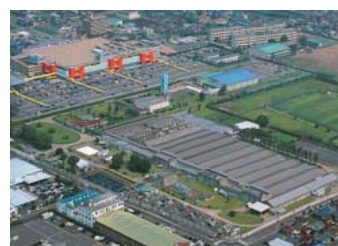
ニッケ岐阜工場 NIKKE GIFU MILL