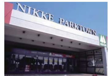
ニッケパークタウン NIKKE PARKTOWN OFFICE