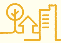
人とみらい 開発事業