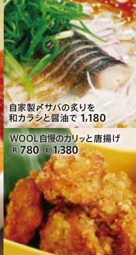
自家製サバの炙りを和カラシと醤油で 1,180