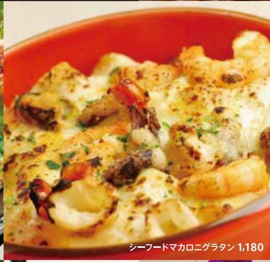
シーフードマカロニグラタン 1,180