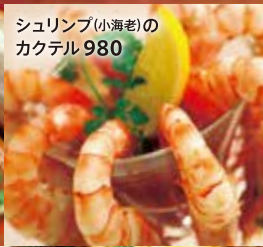
シュリンプ(小海老)のカクテル 980