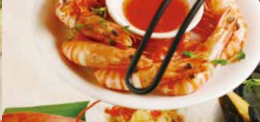
蒸したてオーシャンプレート 2,980