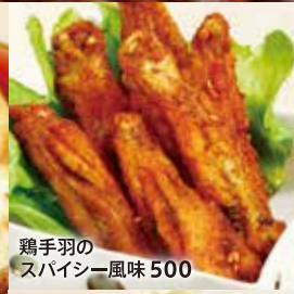
鶏手羽のスパイシー風味 500