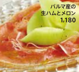
パルマ産の生ハムとメロン 1,180