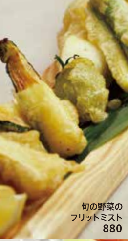
旬の野菜のフリットミスト 880