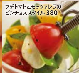
プチトマトとモッツアレラのピンチョスタイル 380