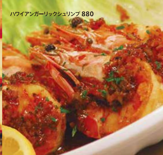
ハワイアンガーリックシュリンプ 880