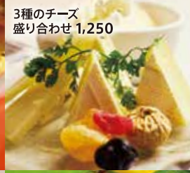
3種のチーズ盛り合わせ 1,250