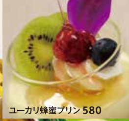
ユーカリ蜂蜜プリン 580