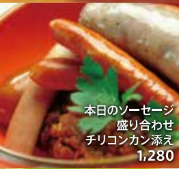
本日のソーセージ盛り合わせチリコンカン添え 1,280