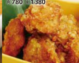
WOOL自慢のカリッと唐揚げ ¥780 税込1,380