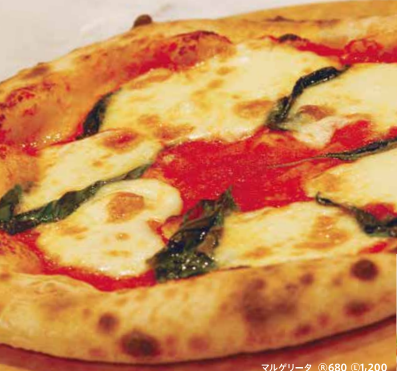
マルゲリータ ¥680 税込1,200