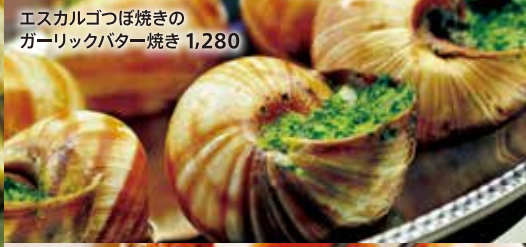
エスカルゴつぼ焼きのガーリックバター焼き 1,280