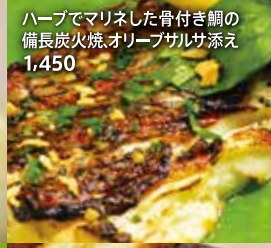
ハーブでマリネした骨付き鯛の備長炭火焼。オリーブサルサ添え 1,450