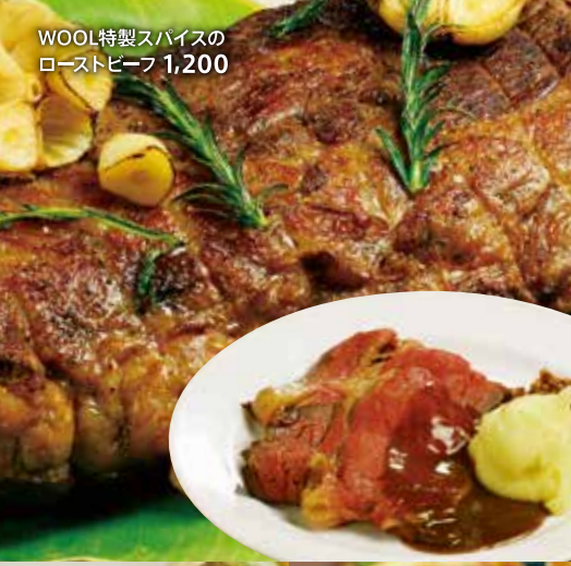
WOOL特製スパイスのローストビーフ 1,200