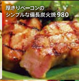
厚きりベーコンのシンプルな備長炭火焼 980