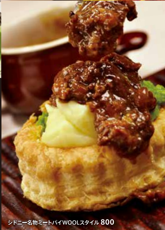
シドニー名物ミートパイWOOLスタイル 800