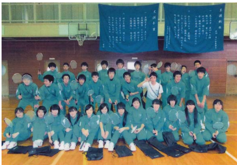
バドミントンの授業を受ける生徒たち

一つの製品、一本の糸から豊かな暮らしを創造することをモットーとしている当社としてこれほど嬉しいことはありません。これからもスポーツ振興、支援を続けていきたいと考えています。