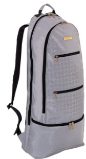
<レディースシリーズ>