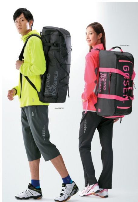
<タウンユースシリーズ>