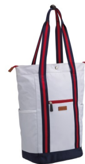
<カジュアルシリーズ>