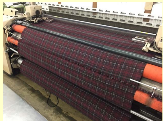
レピア織機（大口織物用）