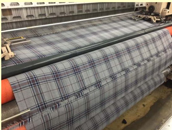
レピア織機（大口織物用）