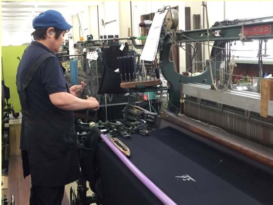
シオンヘル織機（見本・開発織物用）