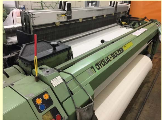
スルザー織機（大口織物用）